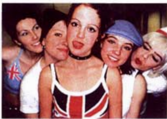
Vagina Grande med Mia i mitten. Ovan: bassolo i replokaten.